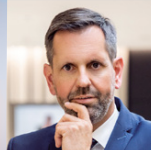
Olaf Lies Niedersächsischer Minister für Wirtschaft, Verkehr, Bauen und Digitalisierung