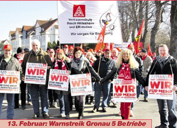
13. Februar: Warnstreik Gronau 5 Betriebe