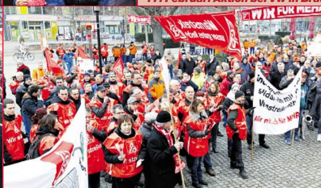
18. Februar: Warnstreik Magdeburg 12 Betriebe