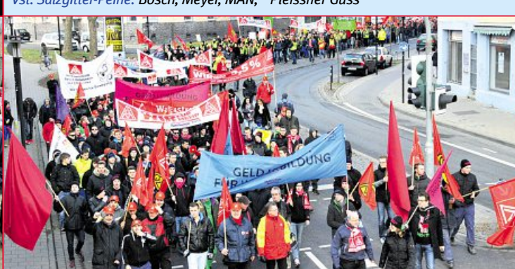
19. Februar: Warnstreik Hildesheim 11 Betriebe