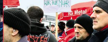
17. Februar: Hettstedt 3 Betriebe