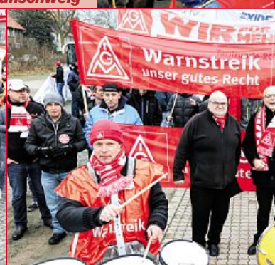
19. Februar: Warnstreik Osterode